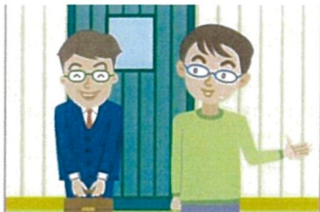
1.預約到府上勘察及估價