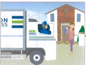
11.海關放行之後,配送行李 到府上.