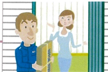
2.服務確認後配送紙箱