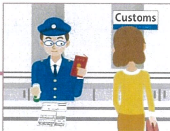
7.行李檢查時需提交別送行李申告書一式2份。 1份給海關人員,1份蓋章後交給服務台