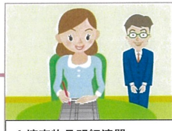
4.填寫物品明細清單