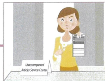
8.提交已蓋章的申告書服務台專員 處理行李清關手續