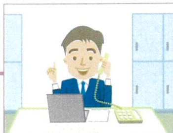
9.日本事務所客戶主任會聯 繫清關及配送的安排